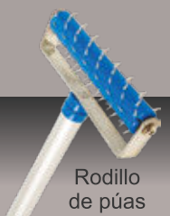
Rodillo de púas